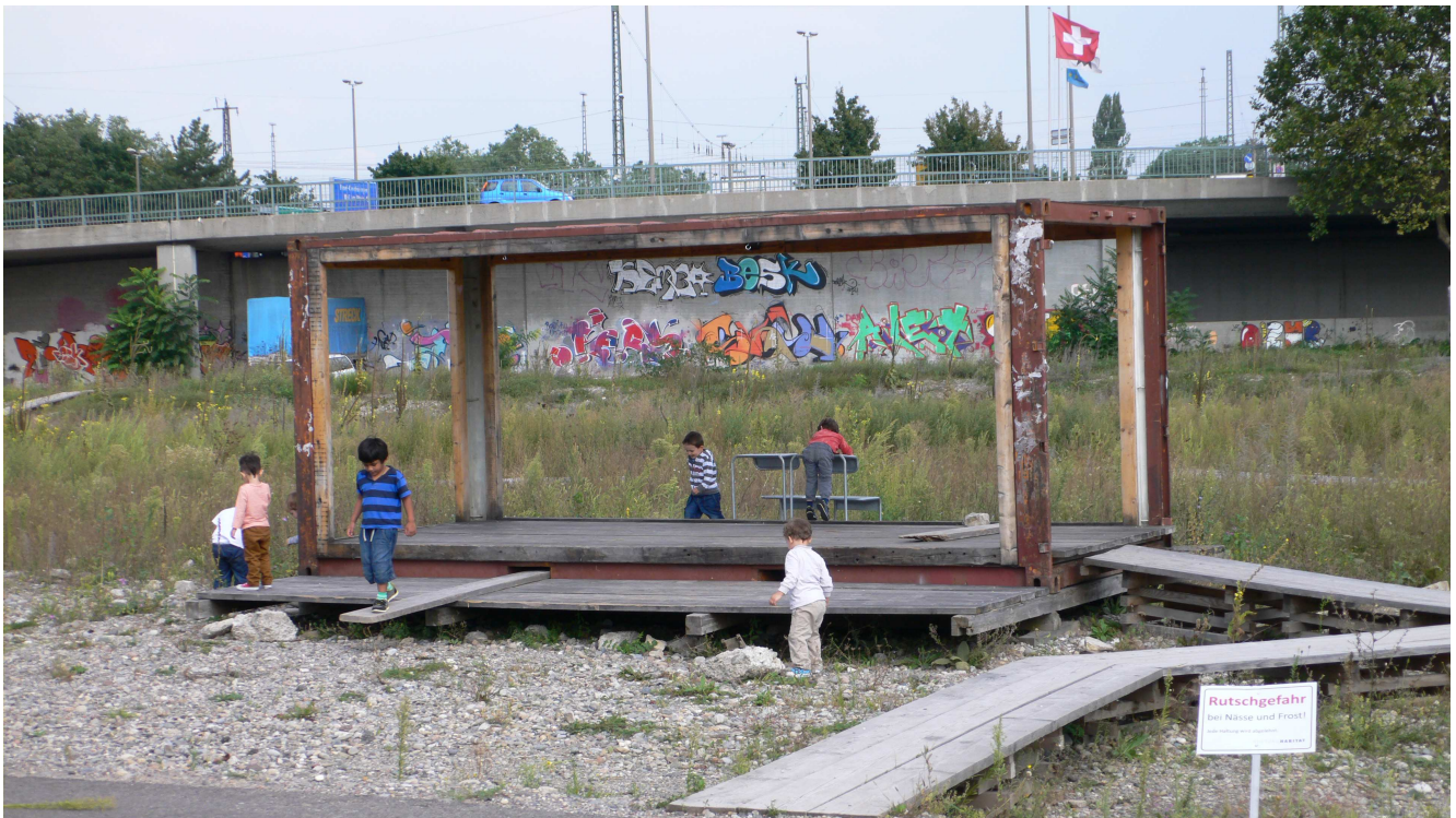
Illustration 1 : Extrait galerie d'images commentées. Un jardin d'enfants a été créé sur une ancienne friche industrielle de la banlieue de Bâle (Suisse). Cette installation provisoire marque le retour des habitants sur un espace depuis longtemps abandonné.