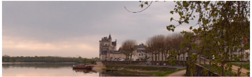
Le Val de Loire, patrimoine mondial : site classé de la confluence Vienne-Loire et château de Montsoreau

C'est en effet l'État, signataire de la Convention de 1972, qui est seul responsable de la gestion du bien dont il a proposé l'inscription, et ceci quel que soit le degré d'autonomie dont pourraient bénéficier les collectivités