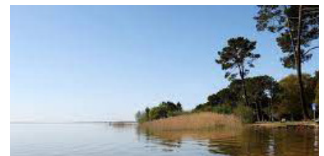
Lac de Cazaux

mobilités décarbonées, énergies renouvelables, agroécologie, risques naturels liés au changement climatique (intervention de "paysagistes de l'urgence"), patrimoine naturel etc. Une restitution synthétique des travaux en présence de Jacqueline Gourault, a permis à la ministre de la cohésion des territoires de saluer le rôle et l'action des paysagistes-conseils